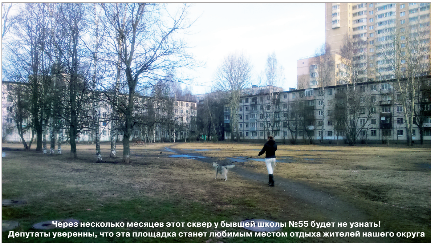
Через несколько месяцев этот сквер у бывшей школы №55 будет не узнать! Депутаты уверены, что эта площадка станет любимым местом отдыха жителей нашего округа

В сквере на ул. Ак. Байкова, д.17, к.2. планируется провести работы по устройству пешеходных дорожек и восстановлению газона. Спортивная площадка приобретет новый вид: появится прорезиненное ударопоглощающее основание. Здесь установят тренажеры и гимнастические комплексы. По просьбам жителей поменяется конфигурация детской площадки и произойдет замена покрытия основания из набивного на прорезиненное. Будут выполнены работы по санитарной прочистке сухих ветвей деревьев. Между детской и спортивной площадками планируется разбить зону отдыха, на которой установят скамейки и урны. В озеленении сквера основной упор будет сделан на красивоцветущий кустарник спиреи японской. К растущим деревьям прибавится береза и рябина. Ее яркие грозди будут радовать горожан в холодные осенние и зимние питерские месяцы.