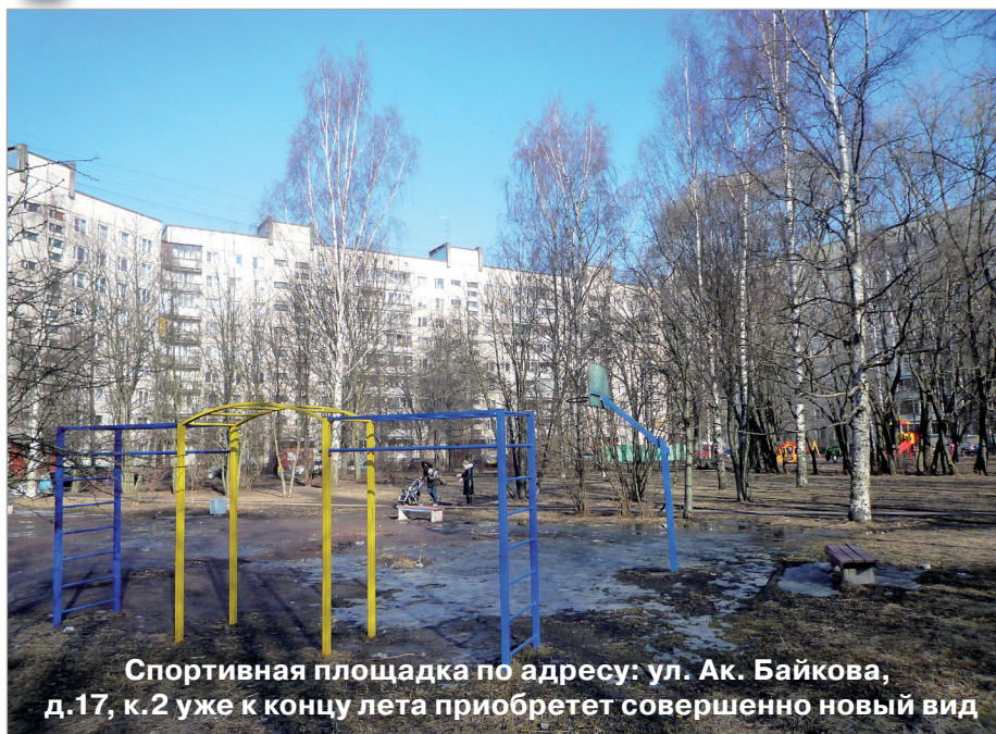
Спортивная площадка по адресу: ул. Ак. Байкова, д.17, к.2 уже к концу лета приобретет совершенно новый вид

порядок – заменят существующее основание на прорезиненное, установят детское игровое и спортивное оборудование. Восстановят газоны и установят новые урны и скамейки, а также газонные ограждения. Кроме того будет произведен ремонт асфальтобетонного покрытия проезда между сквером и ограждением учебных заведений. Появятся здесь и новые пешеходные дорожки.