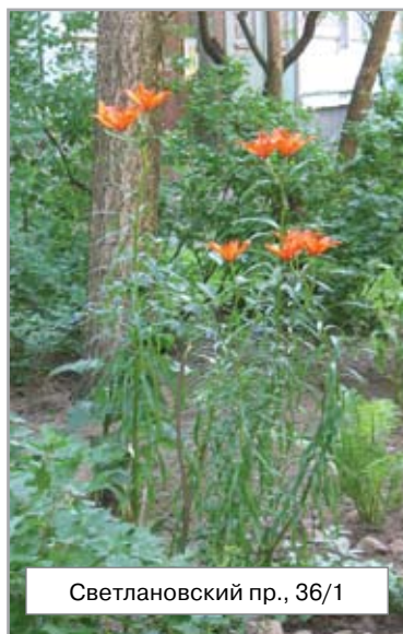
Светлановский пр., 36/1