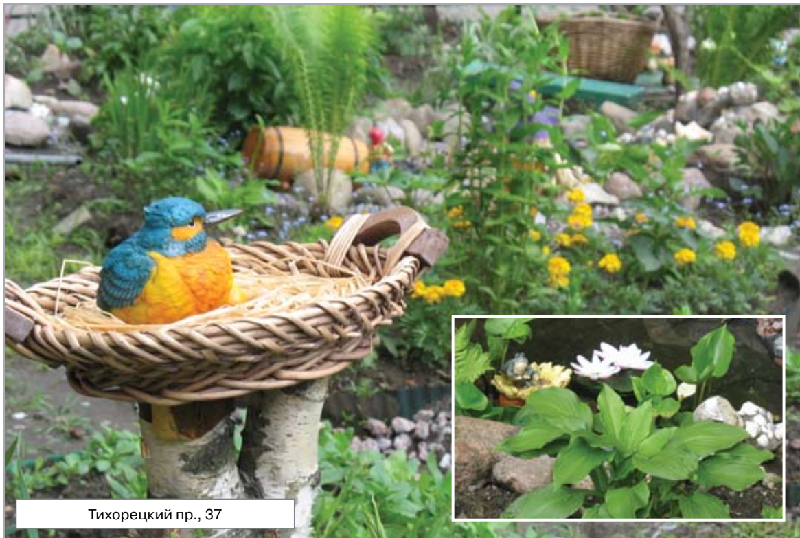
Тихорецкий пр., 37

Для получения справок можно звонить по телефону: 555-26-59.