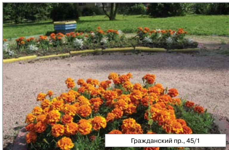
Гражданский пр., 45/1