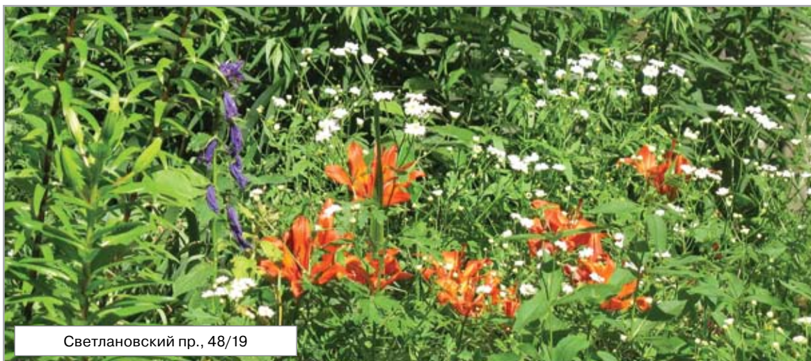
Светлановский пр., 48/19