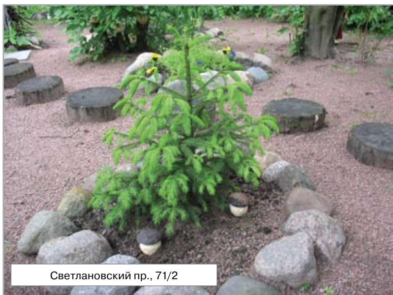
Светлановский пр., 71/2