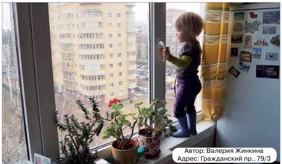
Автор: Валерия Жинкина Адрес: Гражданский пр., 79/3