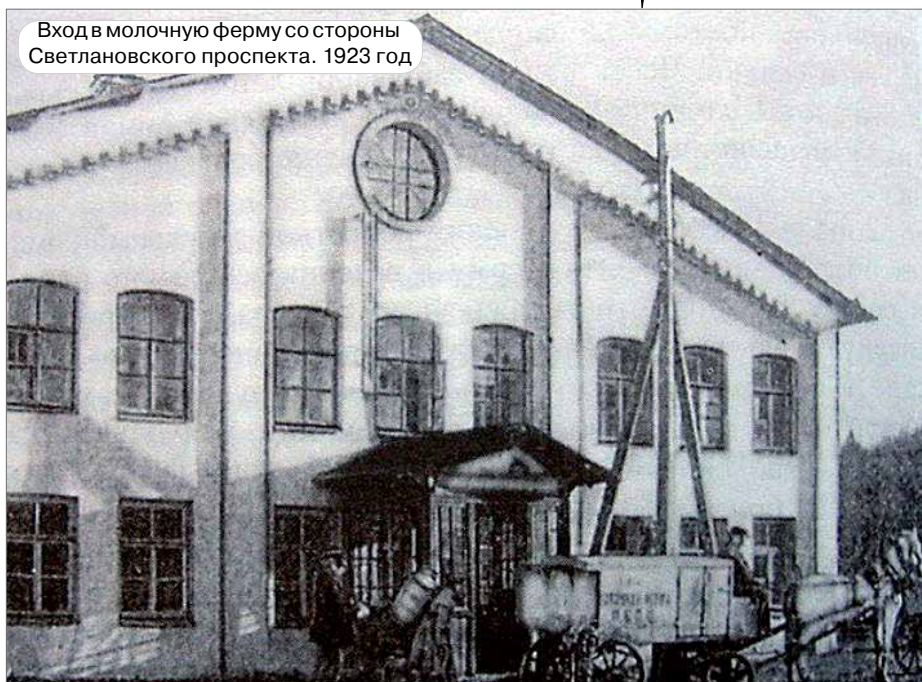
Вход в молочную ферму со стороны Светлановского проспекта. 1923 год

Лесная молочная ферма Ю.Ю. Бенуа включает три здания постройки начала XX века: сгоревшую деревянную дачу, коровник и административный корпус. Они находятся на территории сада Бенуа, также являющегося объектом культурного наследия регионального значения. Восстанавливать фасады всех трех зданий будут по