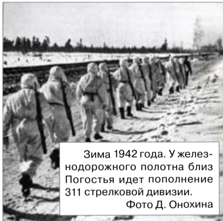
Зима 1942 года. У железнодорожного полотна близ Погостья идет пополнение 311 стрелковой дивизии.

Уже позже мне удалось побеседовать с бывшим солдатом, который проходил через станцию весной 1942 года. Он мне рассказывал, что почти на каждом квадратном метре земли лежал погибший солдат.