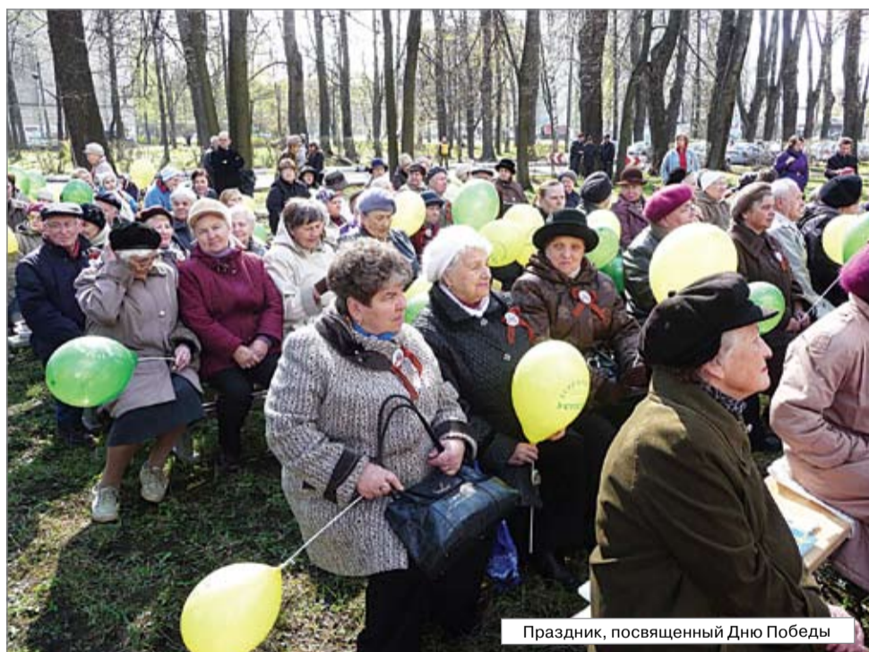
Праздник, посвященный Дню Победы

Великий праздник мы отметили широко и торжественно. Нашлось место всему: и традиционным мероприятиям, и новым интересным событиям. По традиции, военно-полевая кухня разверну-