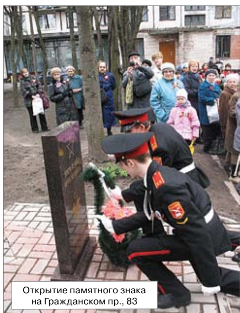
Открытие памятного знака на Гражданском пр., 83

священных главным государственным праздникам, а также памятным датам Великой Отечественной войны.