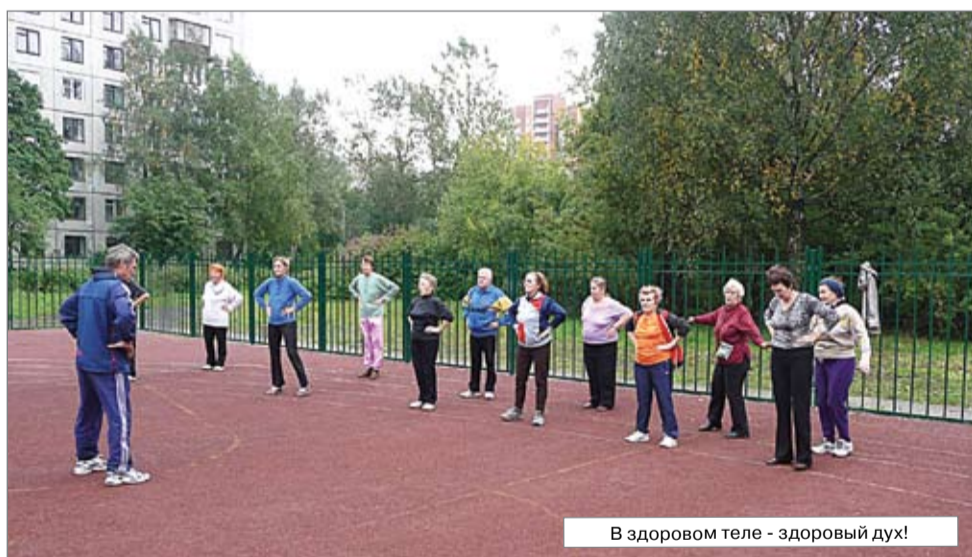
В здоровом теле - здоровый дух!

В нашем округе принято заботиться о старшем поколении не только в канун