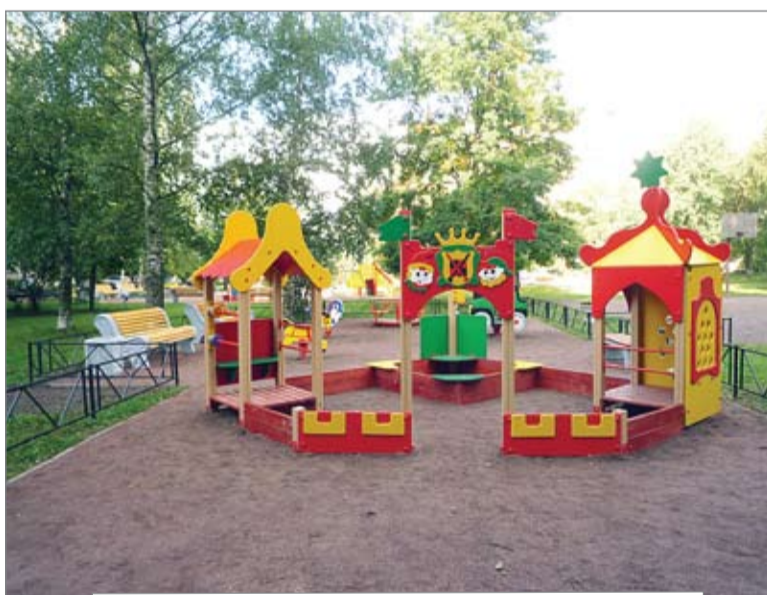
Детская и спортивная площадки на ул.Вавиловых, 4/1

Кроме того, внимание было уделено и внешнему оформлению детских территорий: было установлено 9 декоративных фигур и 3 стенда с правилами пользования детскими и спортивными площадками.