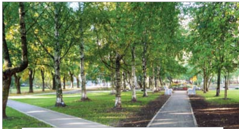
Комплексное благоустройство по адресу: Вавиловых, 11/6

В се мы хотим видеть свой родной двор уютным и красивым. В 2010 году в этом направлении достигнуты новые результаты. Как и прежде, по заявлениям жителей Муниципальный Совет проводил работы по благоустройству скверов и придомовых территорий.