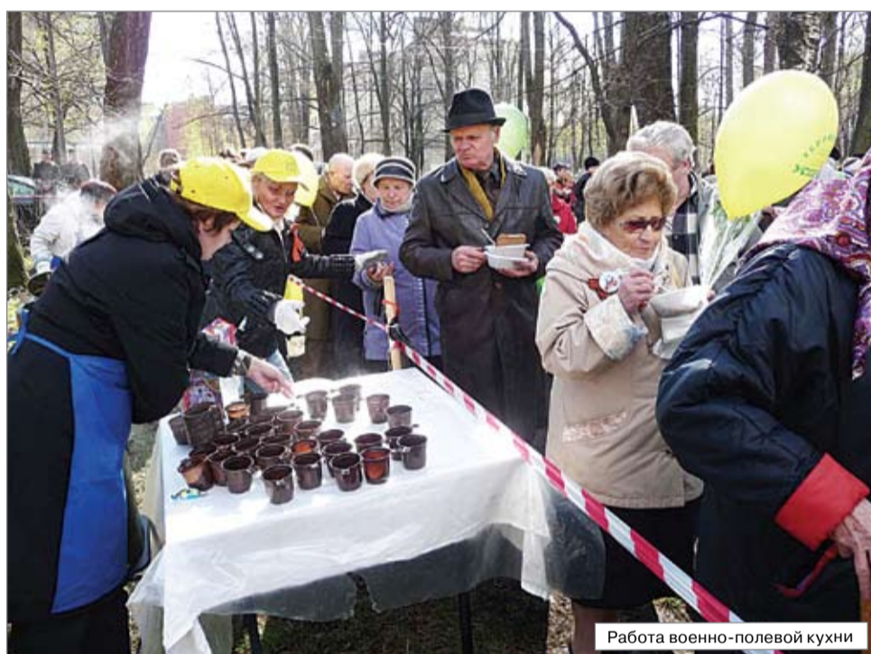
Работа военно-полевой кухни

В этом году для ветеранов и жителей блокадного Ленинграда был организован и проведен ряд мероприятий, по-