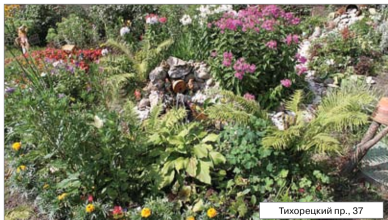
Тихорецкий пр., 37