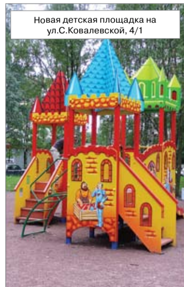
Новая детская площадка на ул.С.Ковалевской, 4/1