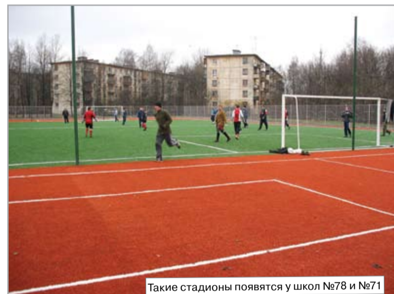
Такие стадионы появятся у школ №78 и №71

– Планируется ли строительство гипермаркета в районе станции метро Академическая?