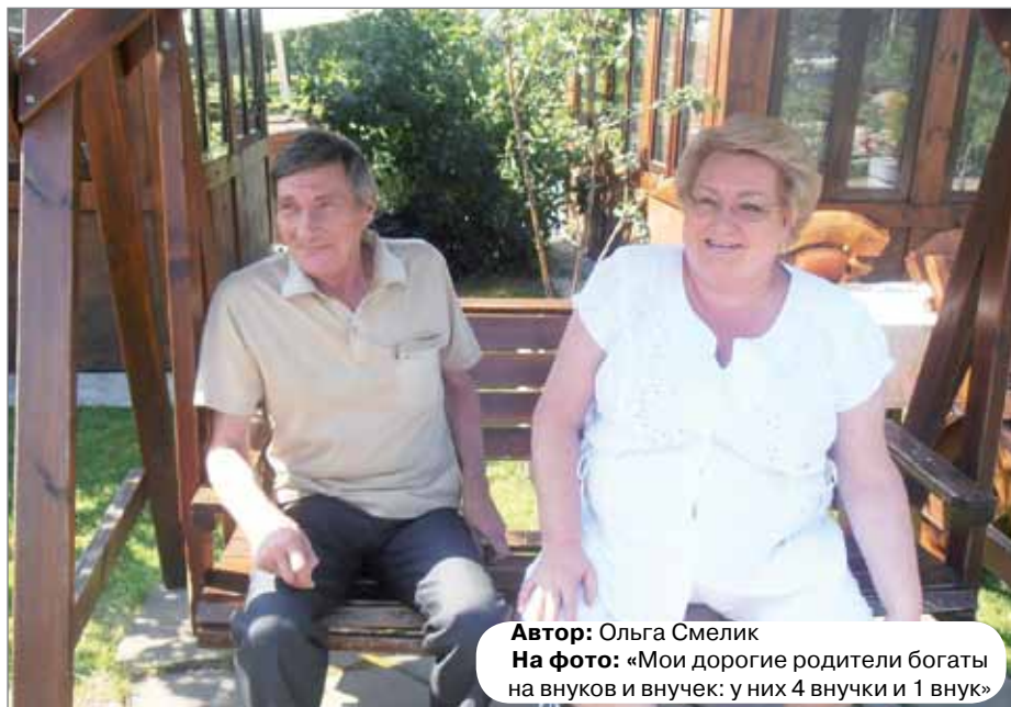
На фото: «Мои дорогие родители богаты на внуков и внучек: у них 4 внучки и 1 внук»

Фото можно прислать на e-mail: tomoa@list.ru с пометкой «Конкурс» или принести в редакцию по адресу: Гражданский пр., д.84, каб. №17. Также вы можете выложить фотографию в специальный альбом нашей группы в "ВКонтакте" http://vk.com/mo_akademka . Просим предоставлять для участия в конкурсе собственные фотоработы. В подписи к фото необходимо указать фамилию, имя, отчество автора фотографии, а также контактные данные (адрес и телефон) и ФИО бабушки и дедушки. Если фотографии выкладываются в альбом «ВКонтакте», то контакты просьба присылать личным сообщением администраторам группы. Приветствуется краткий рассказ.