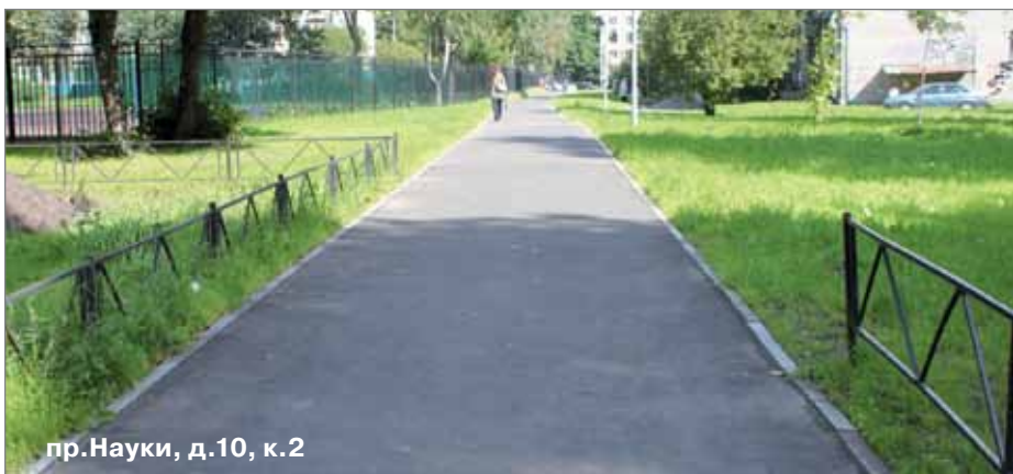
пр.Науки, д.10, к.2