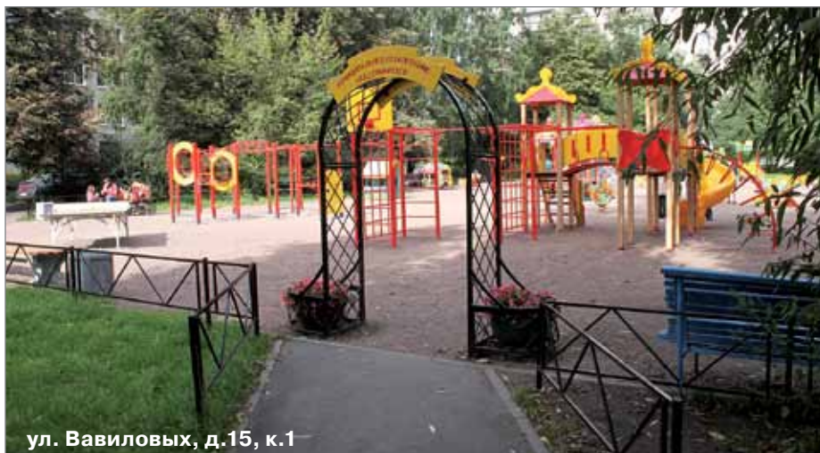
ул. Вавиловых, д.15, к.1