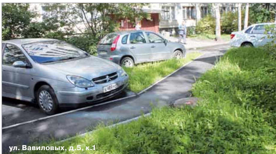
ул. Вавиловых, д.5, к.1