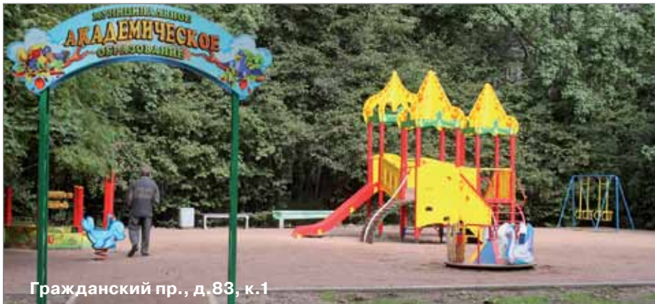
Гражданский пр., д. 83, к.1

- Тихорецкий пр., д.31, к.2 (восстановление газонов, посадка деревьев).