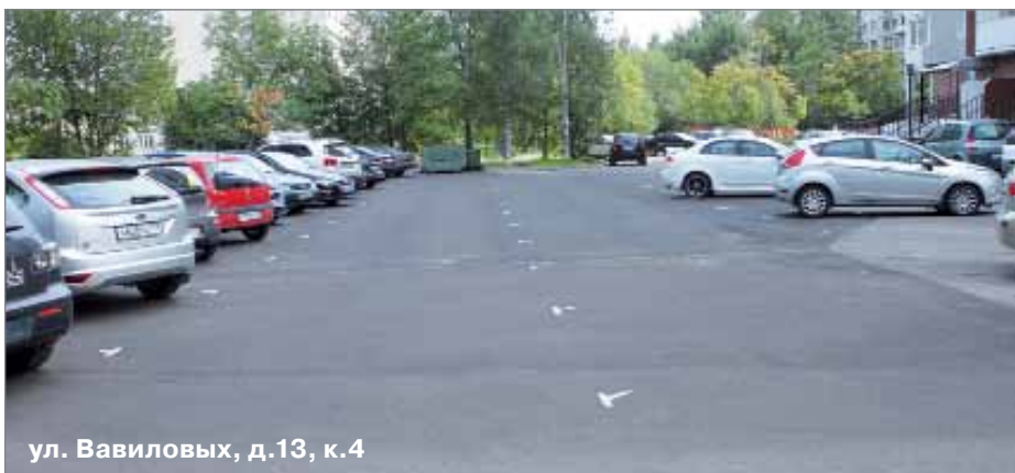
ул. Вавиловых, д.13, к.4