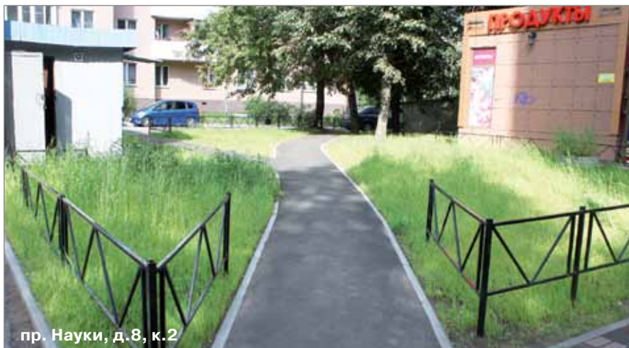
пр. Науки, д.8, к.2