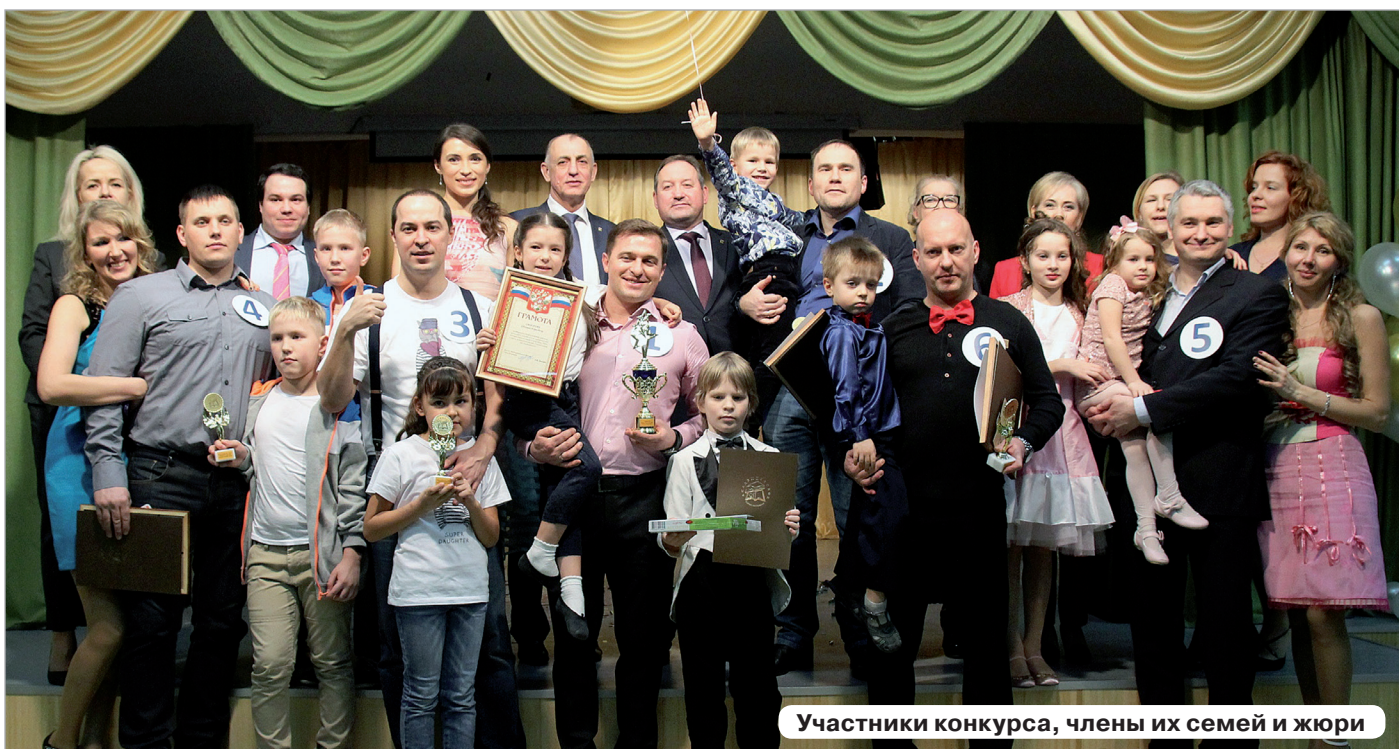
Участники конкурса, члены их семей и жюри