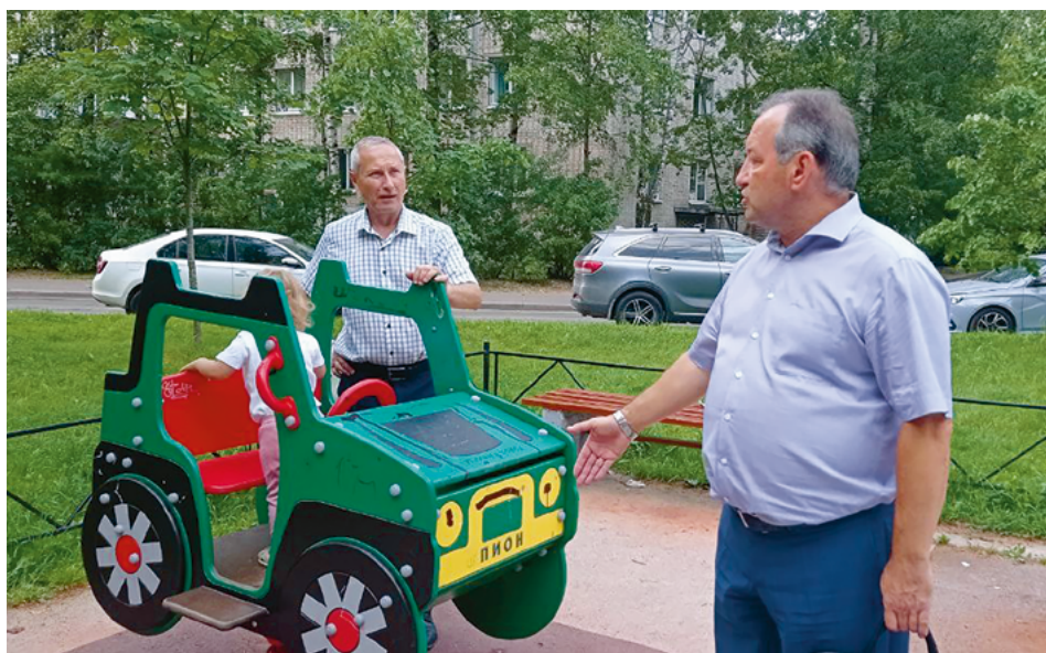
Встреча с жителями на детской площадке

– Да, конечно. К слову, в рамках муниципальной программы «Защита населения и территории от чрезвычайных ситуаций и обучение неработающего населения способам защиты в чрезвычайных ситуациях» в 2023 году планируется приобретение оборудования, учебно-методических материалов, наглядных пособий для обеспечения работы муниципального учебно-консультационного пункта в целях проведения занятий по вопросам ГО и ЧС, интерес к которым многократно возрос.