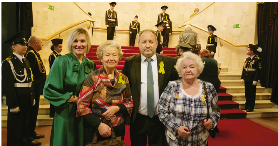
Встреча с ветеранами в День прорыва блокады Ленинграда

– МО Академическое – это, прежде всего, и наша страна. Быть вместе со своим президентом, вместе со всем народом, двигаться в одном направлении – не только наша ключевая обязанность, но и потребность. Местная власть, депу-