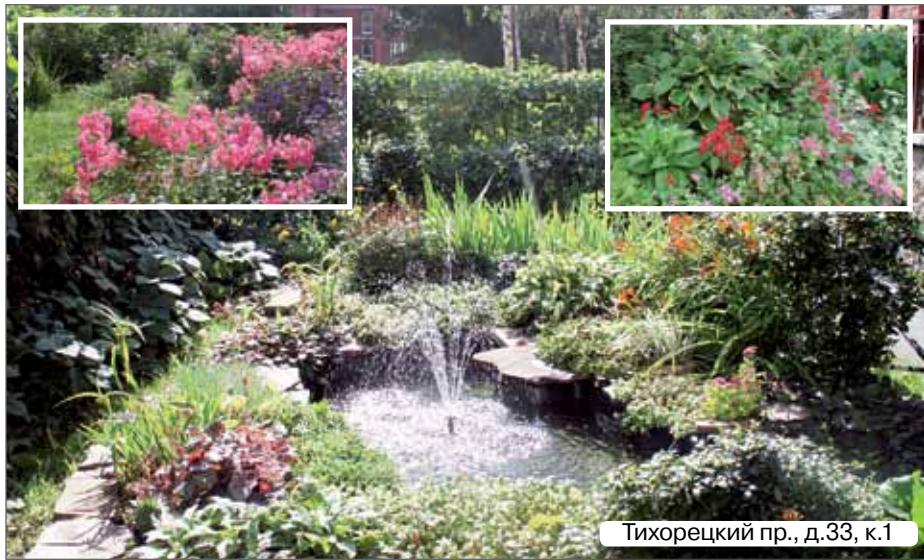
Тихорецкий пр., д.33, к.1