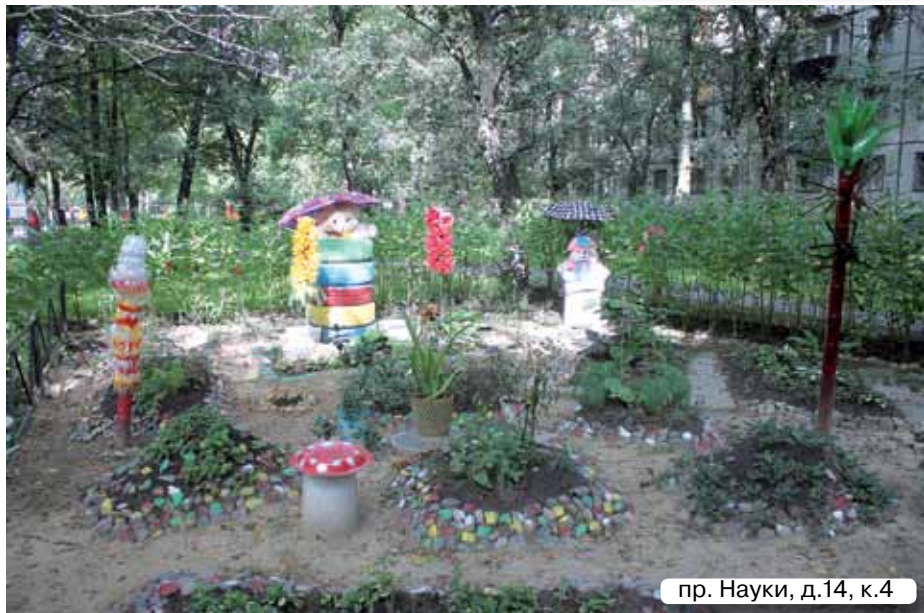
пр. Науки, д.14, к.4