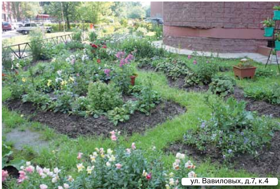
ул. Вавиловых, д.7, к.4