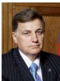
Председатель Законодательного Собрания Санкт-Петербурга, секретарь Санкт-Петербургского регионального отделения Партии «Единая Россия» В.С. МАКАРОВ:

– Сплоченность и единство, консолидация общества помогают нам строить новую, сильную Россию – страну с высокими духовными и нравственными ориентирами, и в решение этой задачи может и должен внести свой вклад каждый из нас. И пусть каждый в этот день ощутит себя патриотом, гражданином великого города и великой страны.