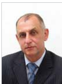
Депутат Законодательного Собрания Санкт-Петербурга 5 созыва Анатолий ДРОЗДОВ:

– Сплоченность и единство, консолидация общества помогают нам строить новую, сильную Россию – страну с высокими духовными и нравственными ориентирами, и в решение этой задачи может и должен внести свой вклад каждый из нас. И пусть каждый в этот день ощутит себя патриотом, гражданином великого города и великой страны.