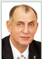
Заместитель Председателя Законодательного Собрания Санкт-Петербурга