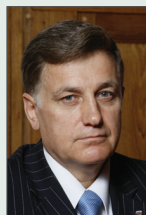
Председатель Законодательного Собрания Санкт-Петербурга