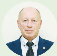
ЛЕОНОВ Алексей Степанович