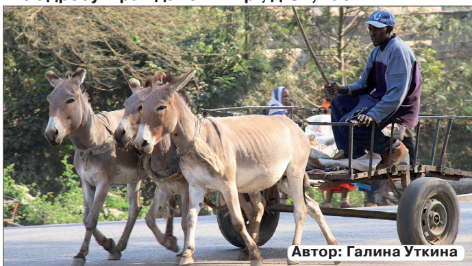
Автор: Галина Уткина

Фотографии для участия в конкурсах принимаются через Интернет-обращение на официальном сайте ОМСУ МО МО Академическое ( http://mo-akademicheskoe-spb.ru/reception/ ), либо в редакции по адресу: Гражданский пр., д.84, каб. №17.