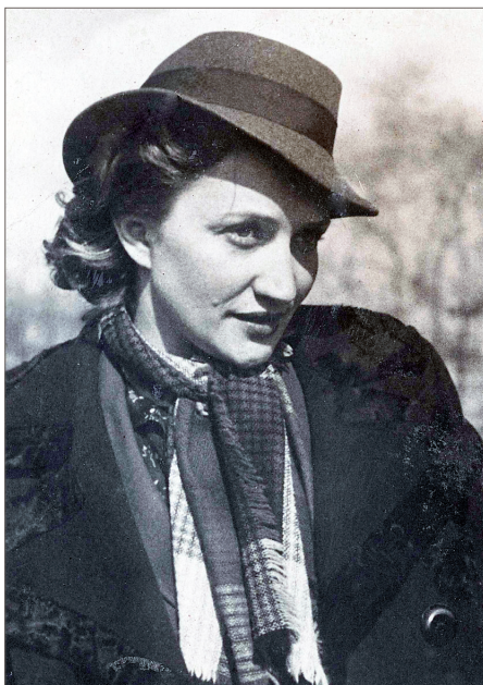
ЛОВЕКА и ВЕРА в ПОБЕДУ, а значит и в будущее семьи.

Иосиф уходит на фронт, а молодая жена надевает военную форму и идет служить военфельдшером в учебно-танковый батальон, который размещался на территории Кировского завода. После разлуки молодожены общались письмами. В них живет ЛЮБОВЬ, ТРЕВОГА за БЛИЗКОГО ЧЕ-