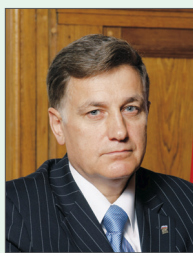
Председатель Законодательного Собрания Санкт-Петербурга В. С. Макаров