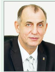
Заместитель Председателя Законодательного Собрания Санкт- Петербурга А.В. Дроздов