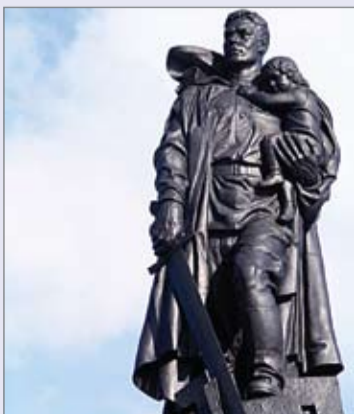
На холме высоком в Трептов-парке Фигура воина российского стоит,

И на руке его, к груди прижавшись, Маленькая девочка сидит.