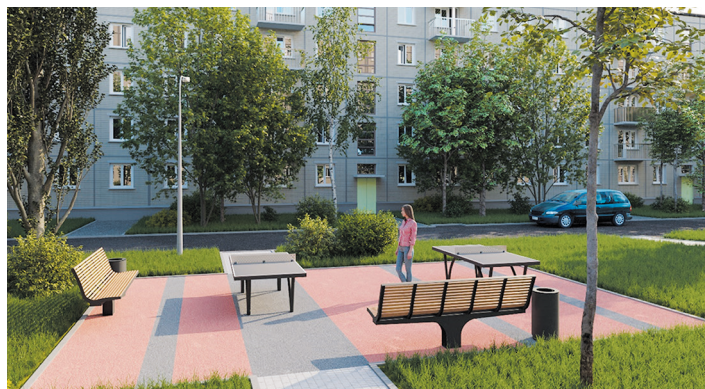
Визуализация проекта по адресу: Науки пр., д. 14, корп. 1 – Софьи Ковалевской ул., д. 12, корп. 2