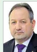
Глава муниципального образования Академическое