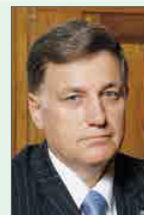
Председатель Законодательного Собрания Санкт-Петербурга