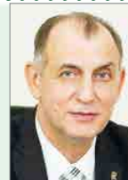
Заместитель Председателя Законодательного Собрания Санкт-Петербурга