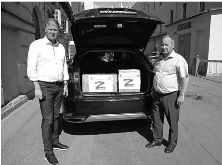
Фото и текст Ульяна Рыжова

Благотворительная акция по сбору необходимых вещей для бойцов СВО в муниципальном образовании Академическое продолжается. Благодарим всех, кто принимает в ней участие. Что можно принести: носки, нижнее белье, перчатки строительные, стельки, футболки, продукты питания длительного хранения с действительным сроком годности и т.д. Вещи должны быть новыми. Помощь принимается в общественной приемной ЕР в МО Академическое по адресу: Гражданский пр., д. 84а, каб. 17 или 4 по будням с 10:00 до 13:00 и с 14:00 до 17:00.