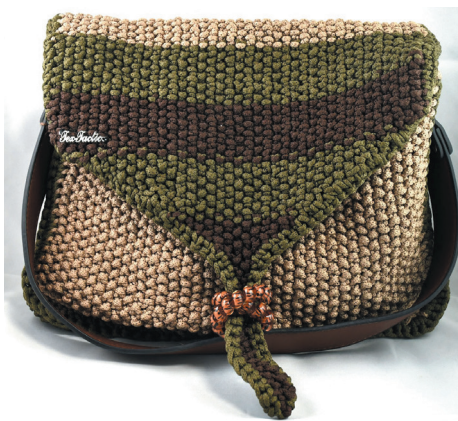
Вязаная сумка в стиле «Бохо»