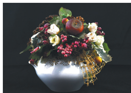
Старая, но дорогая, как память о бабушке, фарфоровая сахарница превратилась в цветочную композицию

ее в цветочную композицию. У старой сахарницы были сколы по горлышку, но теперь под цветами их не видно, общий вид целостен и гармоничен. А ведь эта красота могла быть выкинута, как старая, побитая, отслужившая свое. Так приятно, вернувшись домой, бросить взгляд на маленькую частичку семейного тепла и уюта! Таких вещиц в моем доме много.