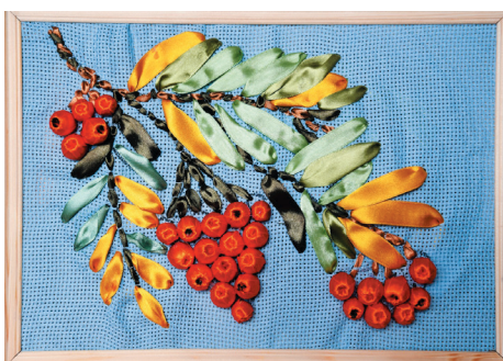
«Гроздь рябины» – вышивка лентами

– Интерес к творчеству у меня появился с детства. Окружающий мир виделся удивительным, особенным. Каждая вещь казалась живой. Камешки, палочки, желуди, каштаны, шишки,