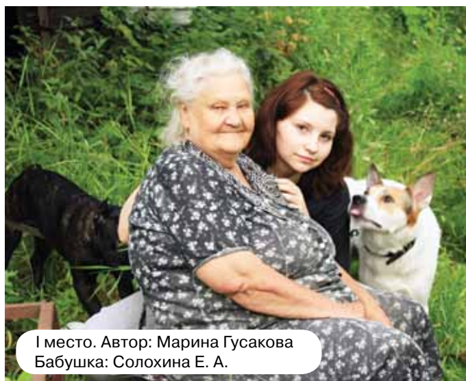
I место. Автор: Марина Гусакова Бабушка: Солохина Е. А.