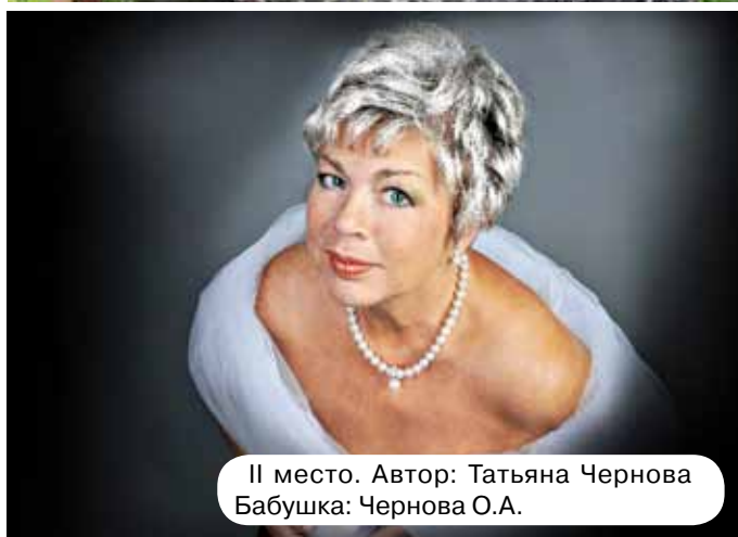
II место. Автор: Татьяна Чернова Бабушка: Чернова О.А.