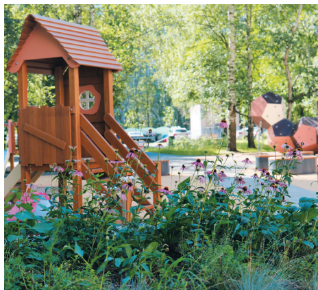
Тихорецкий проспект, д. 37

Достижения органов местного самоуправления муниципального образования Академическое в сфере благоустройства высоко отмечены на городском уровне. Реализованный в 2025 году масштабный проект по обустройству детской площадки по адресу: Тихорецкий пр., д. 37 – удостоен II места на Конкурсе по благоустройству, который проводился Советом муниципальных образований Санкт-Петербурга.