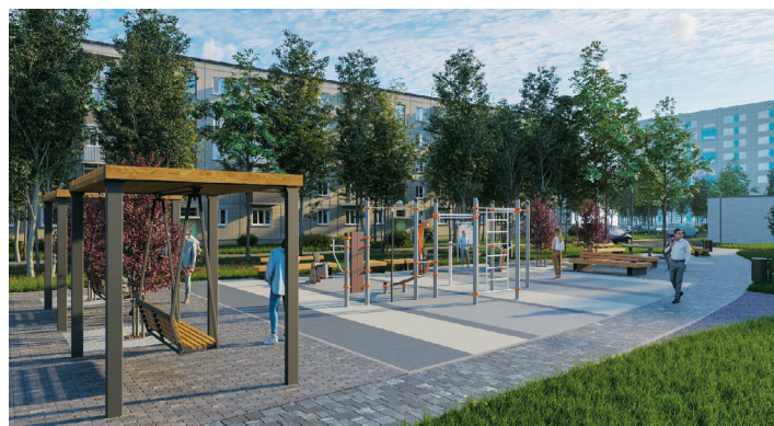
Улица Вавиловых, д. 15, корпус 3