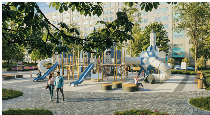
Улица Вавиловых, д. 15, корпус 1

Отремонтировано набивных покрытий 150 м 2 .