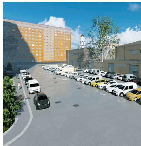
Улица Обручевых, д. 5

По адресу: ул. Вавиловых, д. 15, к. 1 будет обустроена детская площадка в космическом стиле, а также зона отдыха со скамейками и перголами.