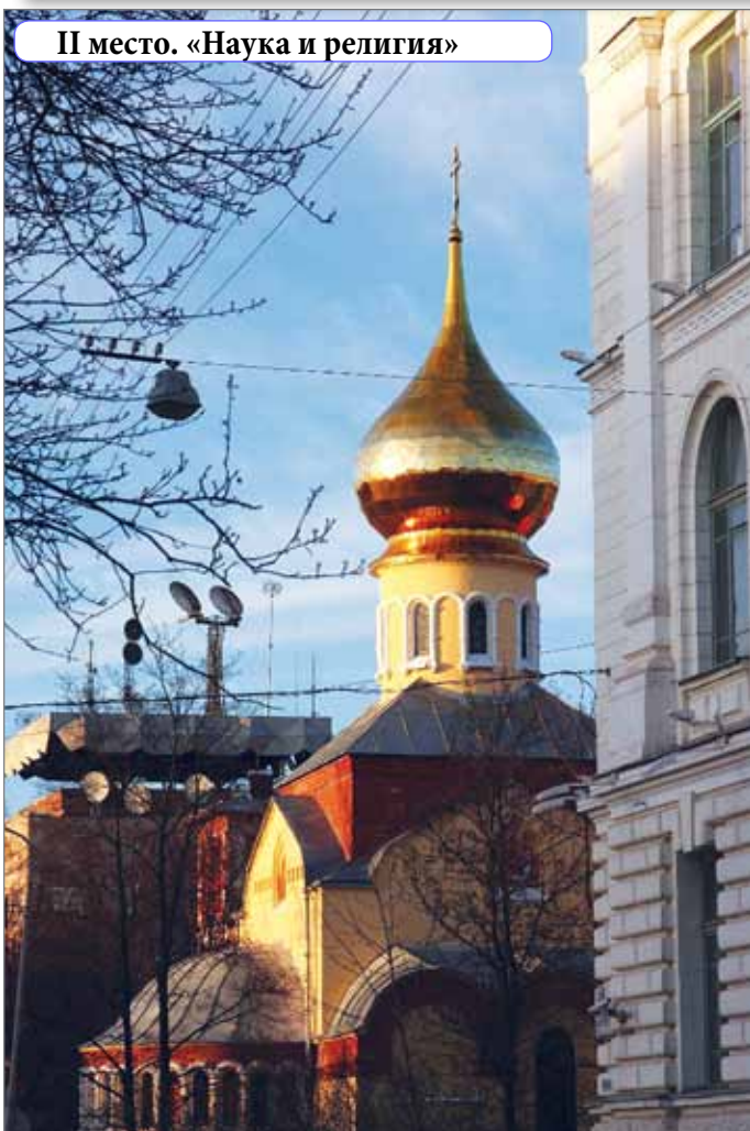
II место. «Наука и религия»