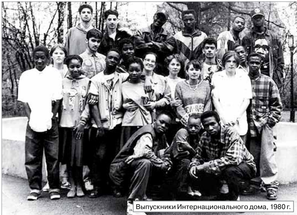
Выпускники Интернационального дома, 1980 г.

Весной 2013 года Интердом будет отмечать 80-летний юбилей. Калининский Красный Крест начинает сбор средств, вещей, игрушек, которые просто необходимы для того, чтобы подарить детям праздник в этот памятный день. Мы просим откликнуться всех, кто может и хочет помочь, кому небезразлична судьба тех, кому в этой жизни повезло меньше. Ведь только объединившись вместе, мы сможем сделать что-то действительно важное. Ждем вас в офисе Калининского отделения Красного Креста по адресу Гражданский пр., 13.