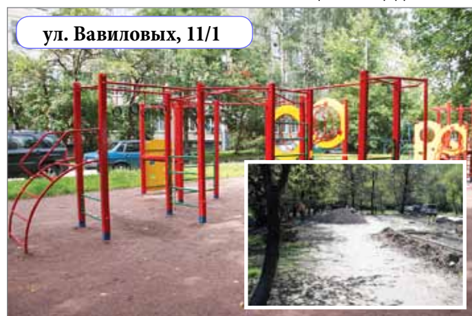
ул. Вавиловых, 11/1