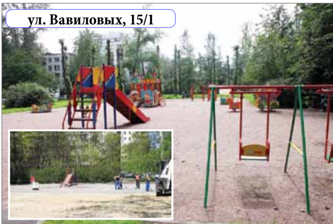
ул. Вавиловых, 15/1

76 элементов детского игрового оборудования установлено по 15 адресам. Кроме выше перечисленных адресов, можно назвать и другие адреса: ул. Вавиловых, д.8 корпус 3, Гражданский пр., д.90 корпус 2, Северный пр., д. 67, Северный пр., д. 65 корпус 1, ул. С.Ковалевской, д.10, Гражданский пр., д. 74 корпус 2.