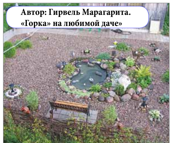
Автор: Гирвель Марагарита. «Горка» на любимой даче»

в редакцию по адресу: Гражданский пр., д.84, каб. №1. Также вы можете выкладывать фотографии (не более трех) в специальный альбом нашей группы в "ВКонтакте" http://vkontakte.ru/club27093524 , сделанных вами в городе и на дачных участках и отражающих тему – клумбы, лужайки, альпийские горки, декоративные поделки. В подписи к фотографиям необходимо указать адрес фотосъемки и свои контактные телефоны.