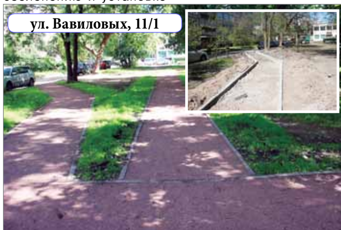
ул. Вавиловых, 11/1

В благоустройстве дворовых территорий мы делаем акцент на том, чтобы уделить максимальное внимание подрастающему поколению, оснастив дворы территории развлечениями для детей. В этом году произведен текущий ремонт оснований детских игровых, спортивных площадок и пешеходных дорожек из набивного основания по 20 адресам общей площадью 12555