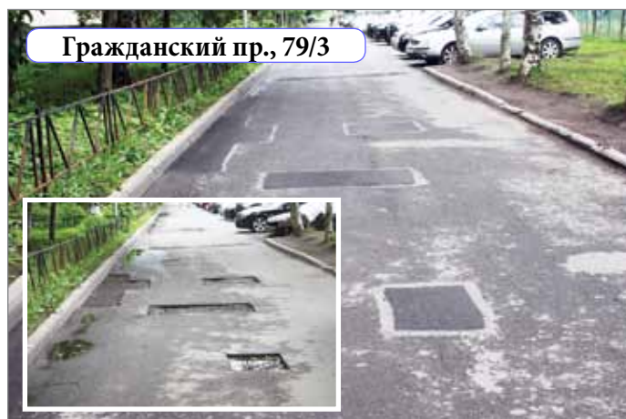
Гражданский пр., 79/3